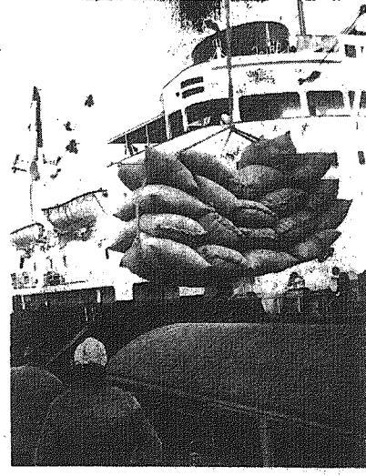
CAF — Ukielewski