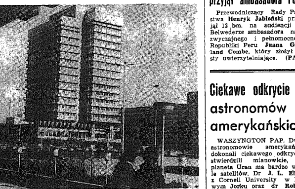
NRD. Fragment nowego osiedla Berlina w pobliżu wieży telewizyjnej.